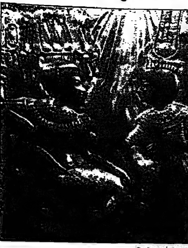
القاهرة - القلم العربي: من تأليف تاشد